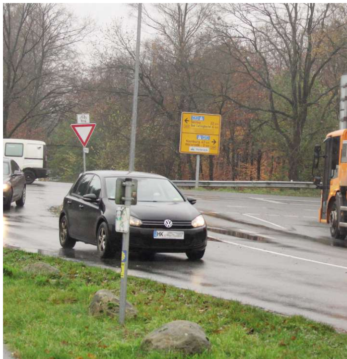
16.000 Fahrzeuge passieren jeden Tag die Einmündung.